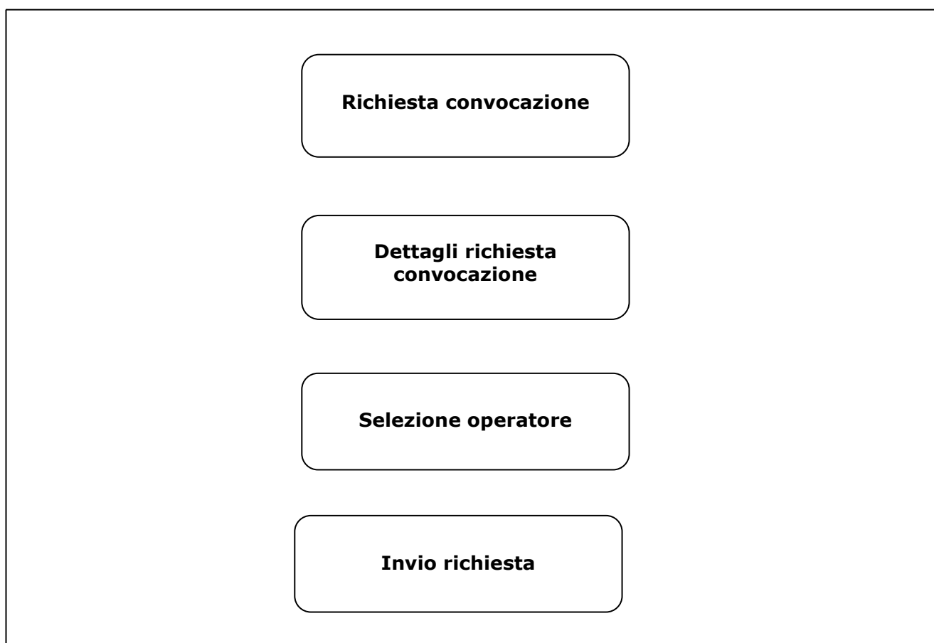
Figura 1 – Pannelli della procedura telematica

La figura seguente illustra i pannelli di cui si compone la procedura.