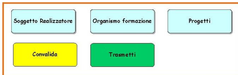
Figura 2 – Procedura telematica – I Livello

Il Sistema per gli Organismi Formativi recupera i dati dalla procedura di Accredimento Organismi Formativi.