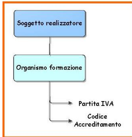
Figura 1 – Procedura telematica - Accesso

In questo capitolo è descritta la procedura telematica per la compilazione e la trasmissione dell'istanza, la figura 1 esplica l'accesso, la figura 2 esplica la sequenza dei pannelli relativa al I Livello di cui si compone la procedura per il soggetto Organismo di Formazione .