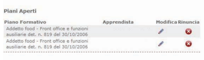
Figura 8 – Piani Aperti

L'utente, per accedere al form di modifica di un Piano Formativo Aperto, deve cliccare sull'apposita icona situata in corrispondenza di ciascun piano (Figura 8).