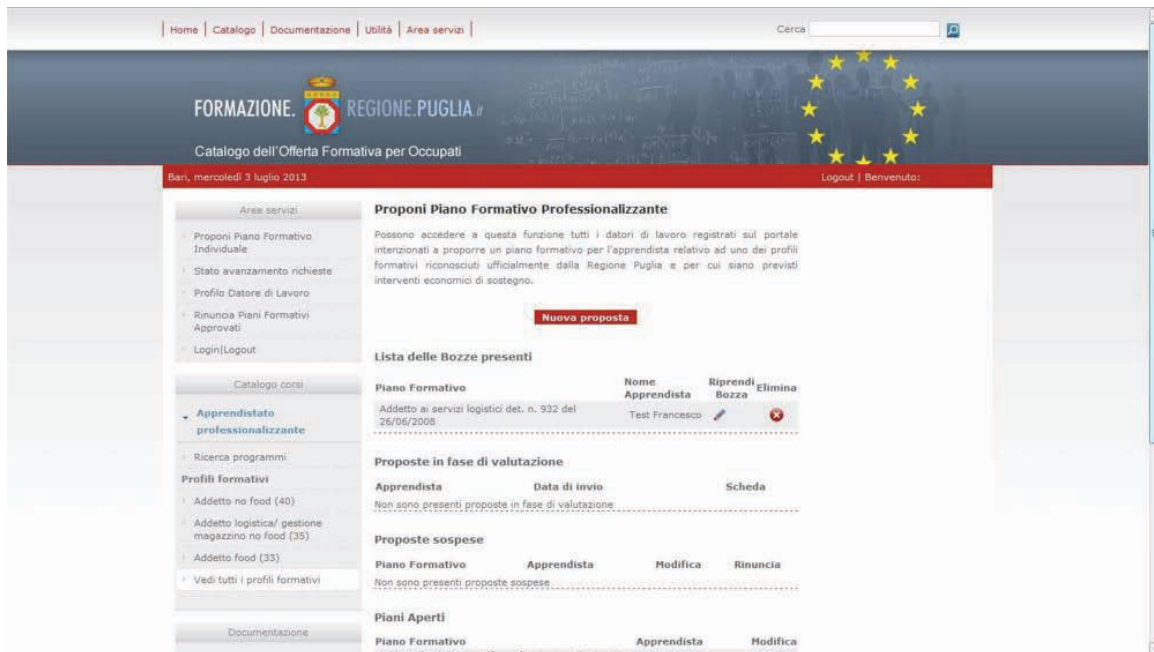
Figura 7 – Piani formativi inseriti