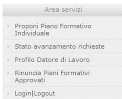
Figura 6 – Area servizi, menu situato alla sinistra del portale

L'utente, cliccando sul link Proponi Piano Formativo Individuale , presente nel menu dell'Area Servizi (Figura 5 e 6), accede alla sezione in cui vengono visualizzati i piani formativi inseriti.