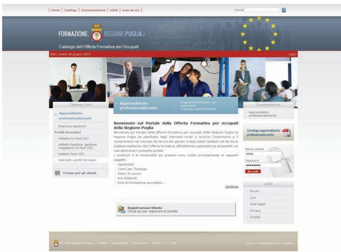
Figura 1- Home page del portale

Per accedere al portale il datore di lavoro inserisce le proprie credenziali all'interno della sezione login presente nella home page (situata nella parte destra della pagina) e clicca sul pulsante Accedi (Figura 1).