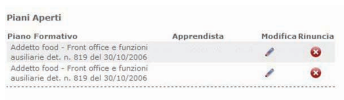
Figura 11 – Piani Aperti

Il sistema proporrà all'utente un pop-up di conferma. L'utente deve cliccare sul pulsante "OK" per proseguire con la rinuncia o "Annulla" per tornare indietro. (Figura 12).