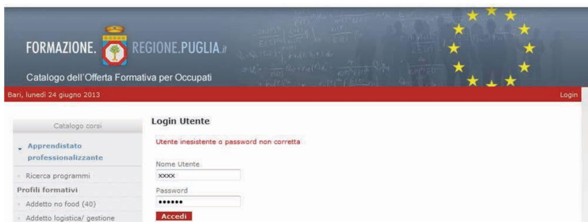
Figura 2 - Login fallito

Se invece i valori di nome utente e password inseriti sono corretti, l'utente viene reindirizzato ad una pagina in cui appare un messaggio di benvenuto ed un link che consente di accedere ai servizi a lui riservati (Figura 3).