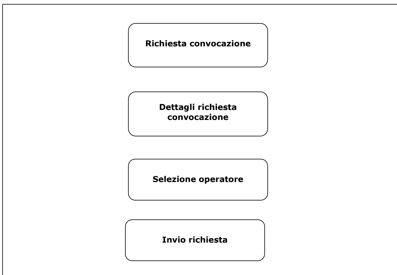
Figura 1 – Pannelli della procedura telematica

La figura seguente illustra i pannelli di cui si compone la procedura.