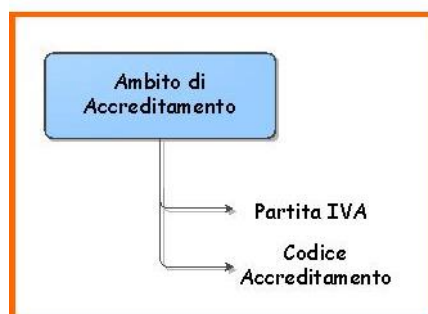
Figura 1 – Procedura telematica - Accesso

Il Servizio telematico per la presentazione della Domanda prevede un pannello introduttivo in cui è attiva la funzione “Crea Domanda”, questo primo step (Figura 1) prevede la selezione dell'Ambito di Accreditamento, dopo l'esecuzione il Sistema recupera i dati.