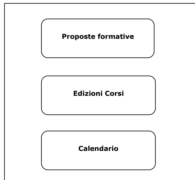
Figura 2 – Schede della sezione Calendario corsi

La sequenza delle schede di cui si compone questa sezione è riportata nella Figura 2.