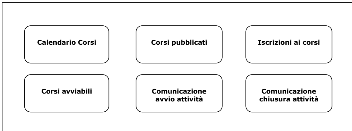
Figura 1 – Sezioni della procedura telematica