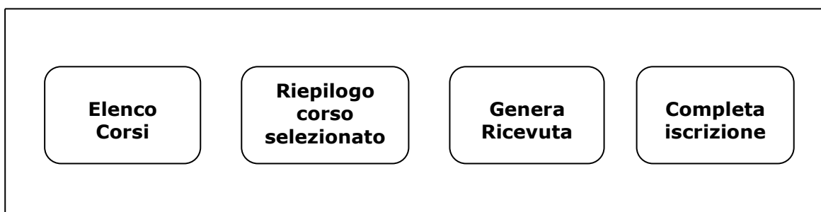
Figura 3 – Pannelli della procedura di Iscrizione ai corsi

La figura seguente riporta la sequenza dei pannelli di cui si compone la procedura.