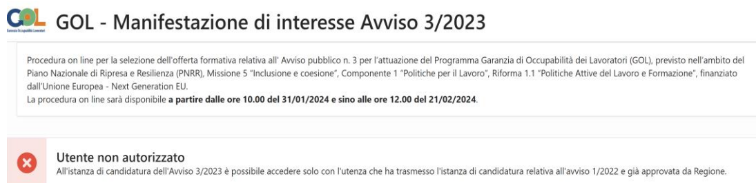
Figura 2 – Accesso utente non abilitato

Nel caso in cui venga effettuato l'accesso al sistema con una utenza certificata differente da quella usata per trasmettere la pratica dell'Avviso 1, oppure con una utenza non riconosciuta, il sistema mostrerà il seguente messaggio di errore: