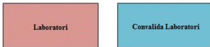
Figura 1 - Struttura della Procedura Telematica

La figura sotto riporta la sequenza dei pannelli di cui si compone la procedura telematica: