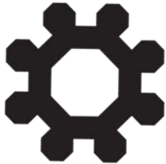
Pianta Castel del Monte