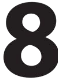
Domini di riferimento